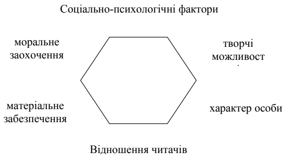
Рис. 2. Модель соціальних комунікацій

Для уявлення корпоративних відношень, що складають поняття журналістської дисципліни, були побудовано 6-ти позиційні моделі. Їх наведено на рис. 2.