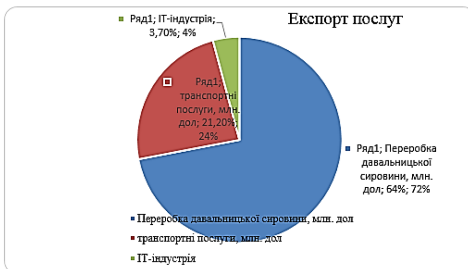
Рис. 3. Експорт послуг в українсько-австрійських відносинах