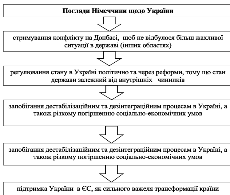
Рис. 1. Погляди Німеччини щодо України

Існує припущення, що оскільки інтерес до України в Німеччині зріс саме через агресію Росії, то існує обґрунтований ризик, що у випадку стабілізації ситуації держава зникне з радарів зовнішньо-політичних пріоритетів Берліну. Більше того, примирення Києва і Москви може дозволити німцям повернутися до звичної «східної політики» з акцентом на відбудову відносин з Росією (Україна при цьому залишалася б «у тіні» такої політики), особливо у разі зміни нинішнього канцлера Німеччини. Підсумуємо погляди ФРН щодо України на рис. 1.